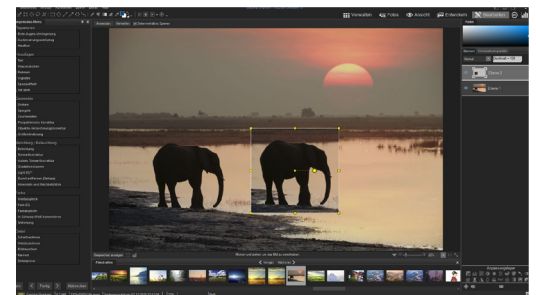
Kreative Möglichkeiten dank Ebeneneditor