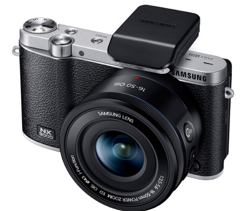
Die einfache Samsung NX3000 mit 20-Mpx-Sensor im APS-C-Format hat Wi-Fi/NFC an Bord.