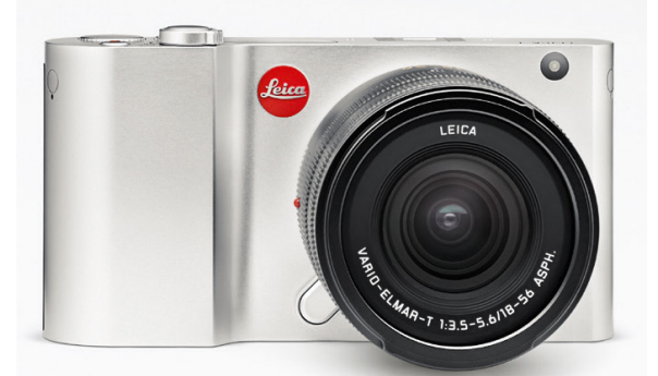
Die Leica T mit APS-C-Sensor begründet das neue T-System. Für M-Objektive gibt es Adapter.

Infos zur Übersicht sowie eine zweite Variante finden Sie auf der Website des Autors: www.markuszitt.ch/downloads Die erweiterte Variante enthält zusätzlich digitale Mittelformatsysteme (Kameras und digitale Rückteile), wogegen die kurze darauf verzichtet. Markus Zitt